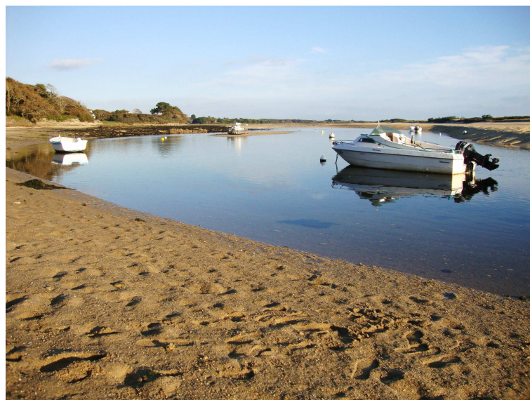
La lagune de la Mer Blanche à marée basse