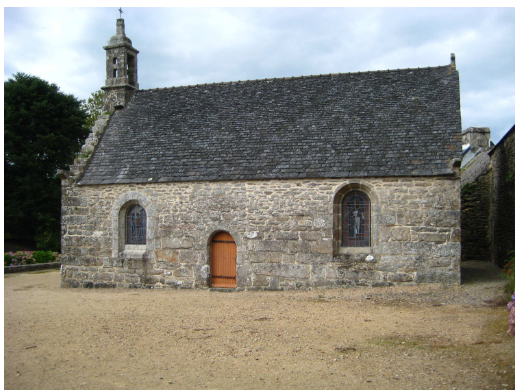
Chapelle Saint Houardon

La randonnée commence par une visite à l'église Saint Jean Baptiste et la chapelle Saint Houardon. Début de la randonnée et vous vous dirigez vers le lieu-dit la gare, prenez à gauche une petite route qui passe devant le camping de la Feuillée. Une halte s'impose à l'écomusée du Youdig . Toujours par une route de campagne, se profile le hameau de Quinoualc'h où vous pourrez admirer la chapelle. Maintenant vous trouvez une route plus importante avec plus de circulation et de nouveau une route de campagne qui vous mènera au hameau de Trédudon le Moine qui était un fief de résistants pendant la dernière guerre. Arrêtez vous quelques minutes pour admirer la magnifique stèle commémorative de la résistance et du panneau. Vous poursuivez toujours par des petites routes jusqu'au hameau de Trédudon l'Hôpital. Le bourg de la Feuillée est proche qui annonce la fin de la randonnée.