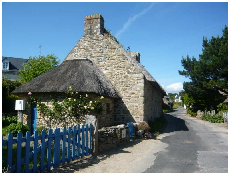
Toit de chaume