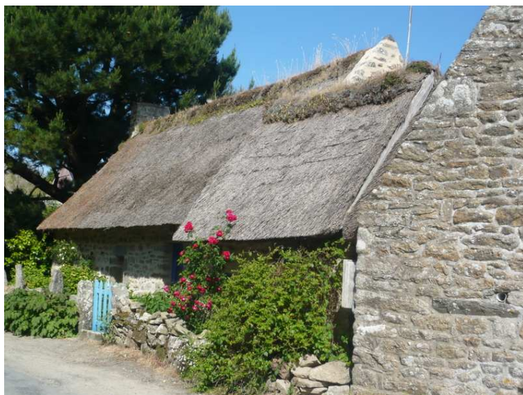
Maison en toit de chaume