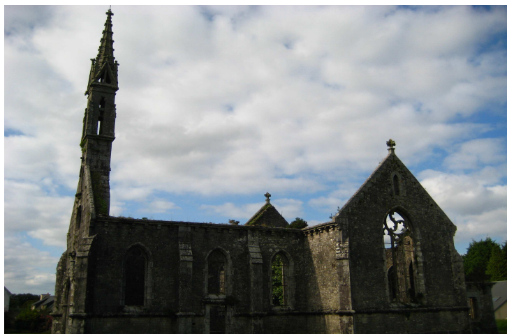
Chapelle en ruines

Après une petite pause vous pourrez visiter l'église et le calvaire dans l'enclos paroissial