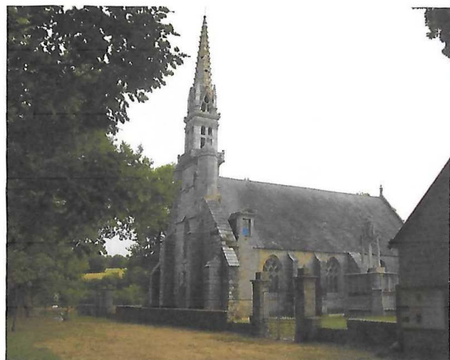
La chapelle de Kerdévet

Ce sera ensuite Trégourez, commune située au cœur de la vallée de l'Odet, avant de terminer, après passage par Le Niver, par une route vallonnée qui vous ramène à votre point de départ