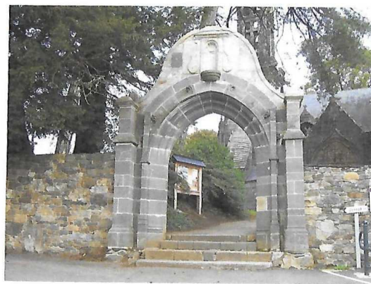
Le Porche de Rumengol

Suivra une longue descente vous permettant de rejoindre votre point de départ.