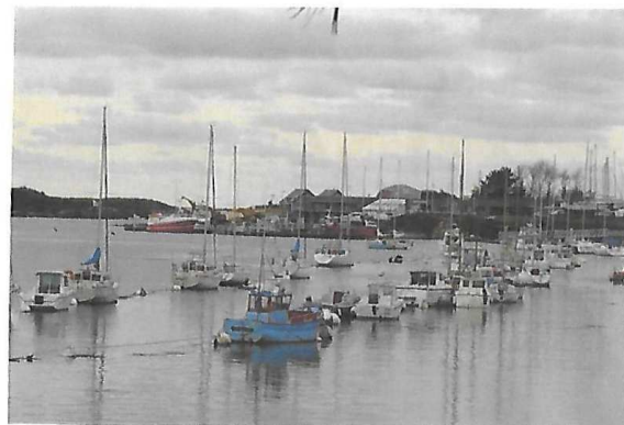
Le Port de Lanildut

Vous retrouverez ensuite le bord de mer, avec à l’horizon les îles Molène et Ouessant, longerez le petit port de Melon, avant de retrouver le bourg de Porspoder